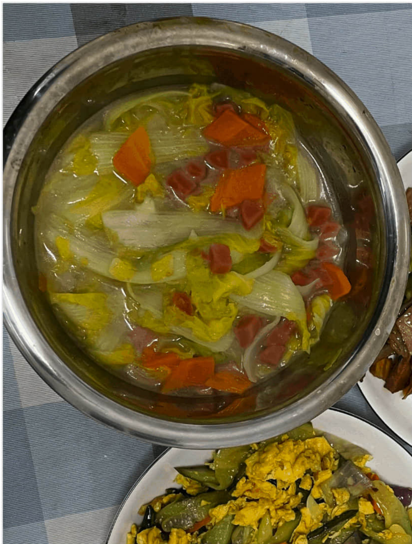
拍照技术有限, 味道还是很不错的